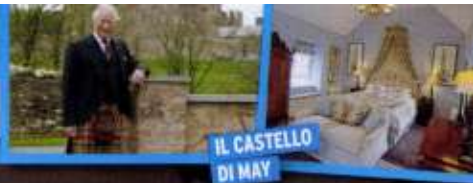
IL CASTELLO DI MAY